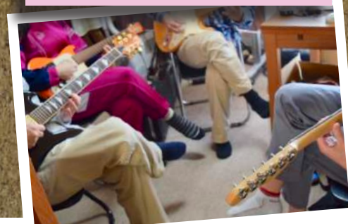
音楽療法で エレキギターを演奏している様子。