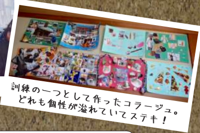
訓練の一つとして作ったコラージュ。 どれも個性が溢れていてステキ！