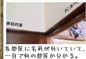
各部屋に名前が付いていて、 一目で何の部屋か分かる。