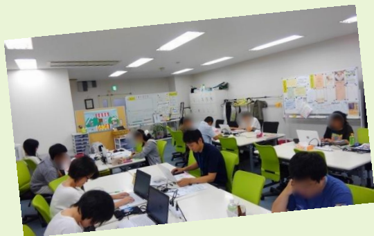
アイワくん ツインちゃん

普段はとてもアットホームな雰囲気なのですが、訓練の時は皆さん真剣モードです(-_-)